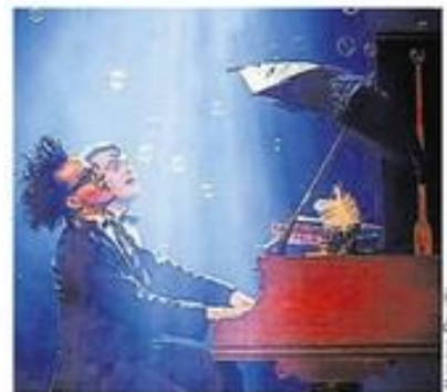
Créativité et prouesses musicales avec les Virtuoses.

Dimanche 20 novembre , à 17 h, au Théâtre Foirail de Chemillé-en-Anjou. Tarifs de 15 € à 31 €. Réservations au 02 41 75 38 34 ou sur scenes.pays-desmauges.fr